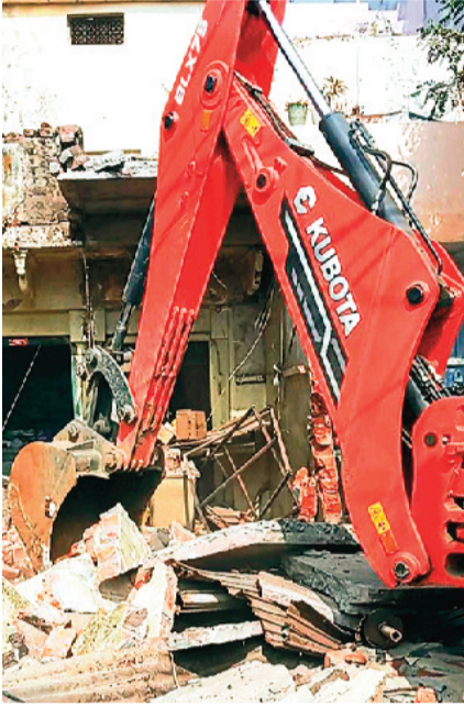
हरिभूमि न्यूज ललितपुर

यातायात को सुगम बनाने, अतिक्रमण हटाने और शहर की मुख्य सड़क का महानगरों की तर्ज पर चौड़ीकरण